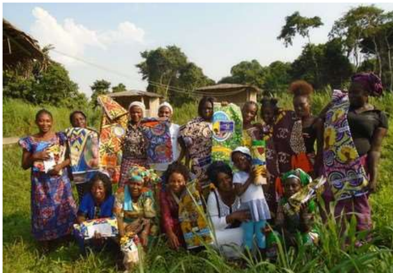
PHOTO: CÉLÉBRATION DE LA JOURNÉE DES DROITS DES FEMMES AVEC LES FEMMES IMPLIQUÉES DANS LES ACTIVITÉS PRO-BIODIVERSITÉ DANS LA ZONE DE PROJET