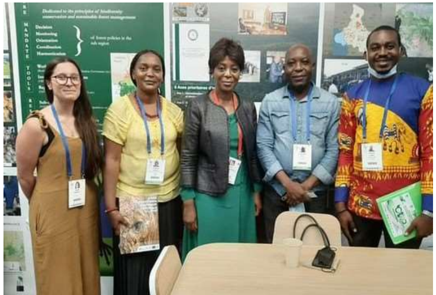
PHOTO: L'ALLIANCE GSAC RENCONTRE MADAME LA MINISTRE LA MINISTRE DE L'ENVIRONNEMENT, DU DÉVELOPPEMENT DURABLE ET DU BASSIN DU CONGO EN REPUBLIQUE DU CONGO