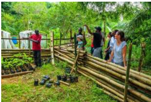
PHOTO: DECOUVERTE DE SGERMOIRS D'ESI CONGO PAR DES VISITEURS

Via ce soutien, ESI Congo a engagé un consultant technique expérimenté pour réaliser un diagnostic en vue d'optimiser l'utilisation de l'espace par la polyculture agricole. Après une première séance de formation technique relative à la production des plants agroforestiers organisée fin 2020, s'en est suivie une autre en février 2021 visant à transmettre les techniques de greffage, marcottage et bouturage aux producteurs de la zone de projet.