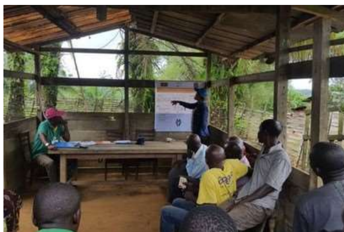
PHOTO: SEANCE DE SENSIBILISATION DES COMMUNAUTES LOCALES A L'EVALUATION IMET DANS LA CONCESSION FORESTIERE DE NTOMBO ET SA PERIPHERIE