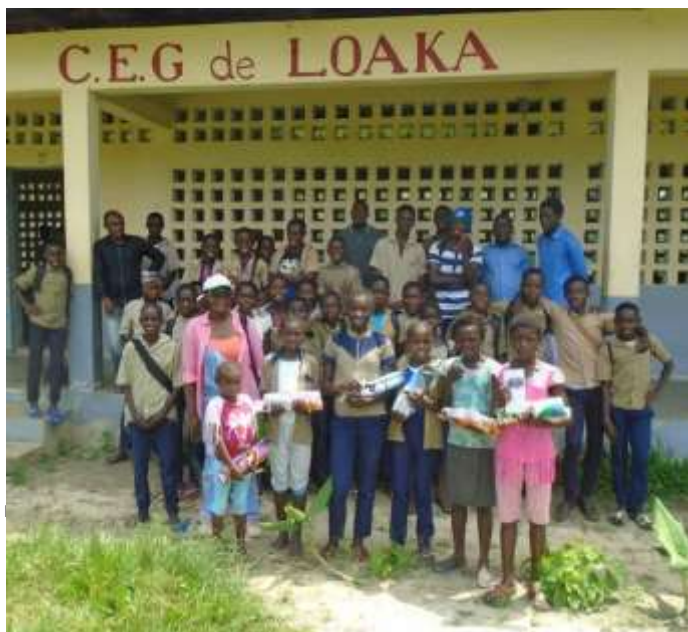
COLLEGE DE LOAKA

Chaque année à la date symbolique de la célébration des droits de la Femme, ES I Congo organise une séance de remise de prix dans les établissements scolaires de la zone de projet en partenariat avec le réseau des enseignants locaux et les sponsors de l'événement. Les élèves filles se démarquant par leur implication et rigueur sur les bancs de l'école, se voient doter d'un kit scolaire ainsi que d'un pagnes. Cette cérémonie est accompagnée d'une sensibilisation à la protection de la nature et le rôle de l'éducation dans la sauvegarde de la biodiversité, ce qui permet de créer un lien direct entre la protection de la nature, l'assiduité scolaire, la récompense et le sentiment de fierté que cela génère chez les écoliers.