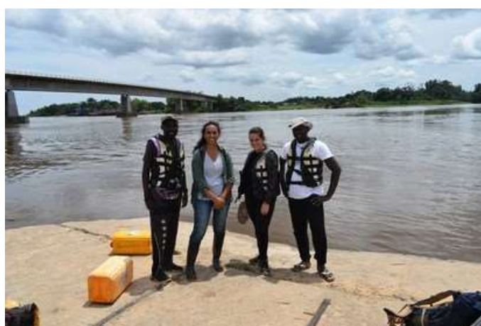
PHOTO: EN COMPAGNIE DE FRANCE VOLONTAIRES CONGO DANS LE CADRE D'UN REPORTAGE SUR LES VOLONTAIRES D'ESI CONGO