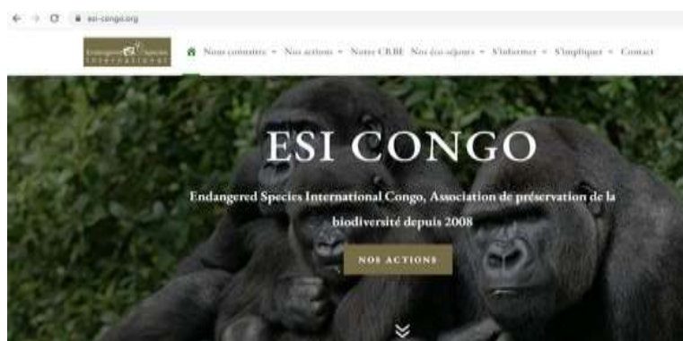
PAGE D'ACCUEIL DU SITE INTERNET D'ESI CONGO

5. Les volontaires nationaux et internationaux d'ESI Congo ont participé à la Journée du Volontariat à l'IFC de Pointe-Noire. Ce fut l'occasion de mettre en lumière les volontaires et leurs actions sur le territoire congolais, et également de créer un cadre d'échanges et de concertation entre les acteurs du volontariat présents au Congo.