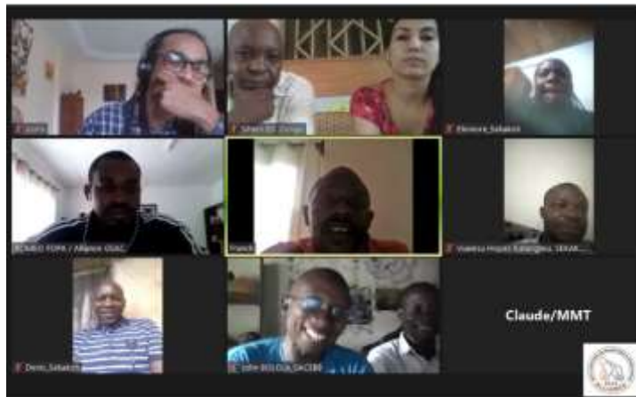
PHOTO: FORMATION EN LIGNE DE L'ALLIANCE GSAC AU PROTOCOLE COVID-19