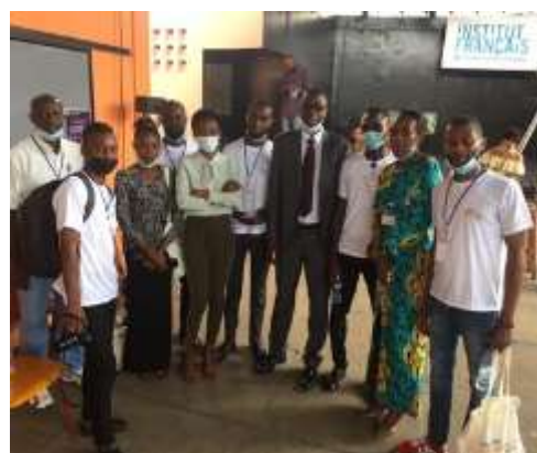
PHOTO: VOLONTAIRES ESI CONGO DURANT LA JOURNEE NATIONALE DU VOLONTARIAT