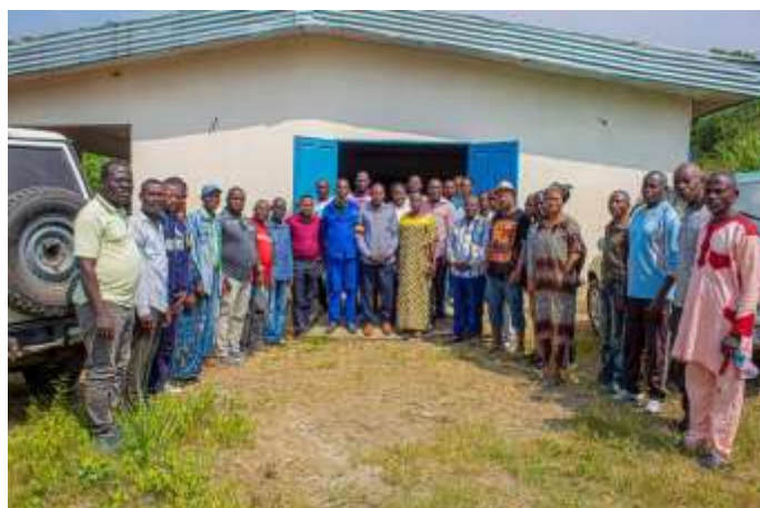
PHOTO DE FAMILLE DURANT L'ATELIER DE RESTITUTION DE L'EVALUATION IMET A LOUVOULOU