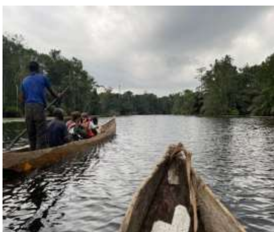
PHOTO: PRISE DE VUE DU LAC KITINA, DANS LA ZONE DE PROJET